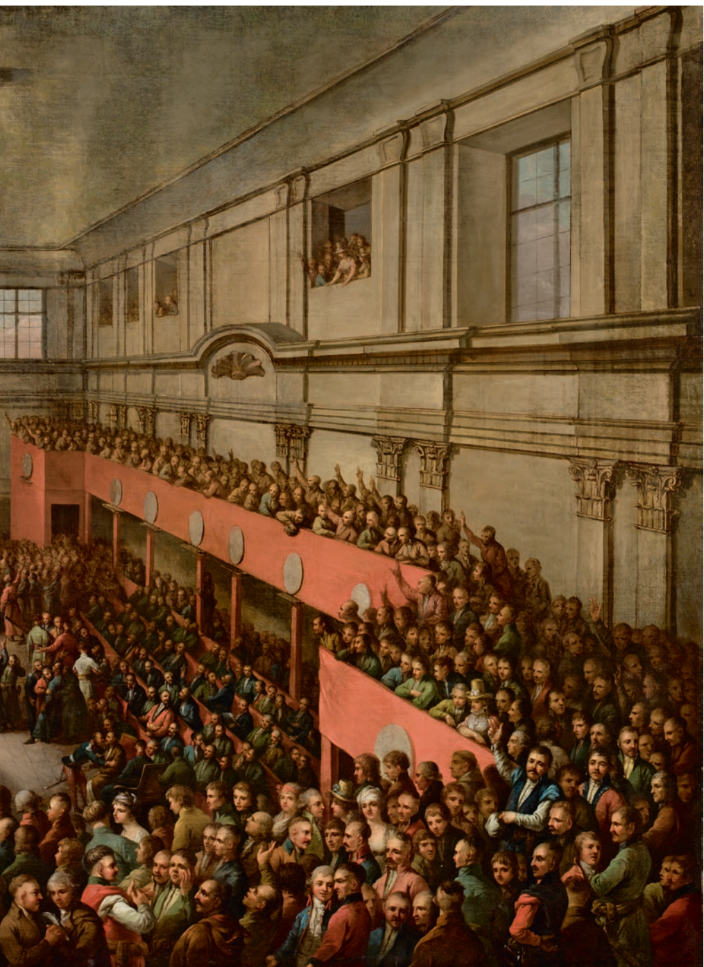
KAZIMIERZ WOJNIAKOWSKI Uchwalenie Konstytucji 3 maja 1806